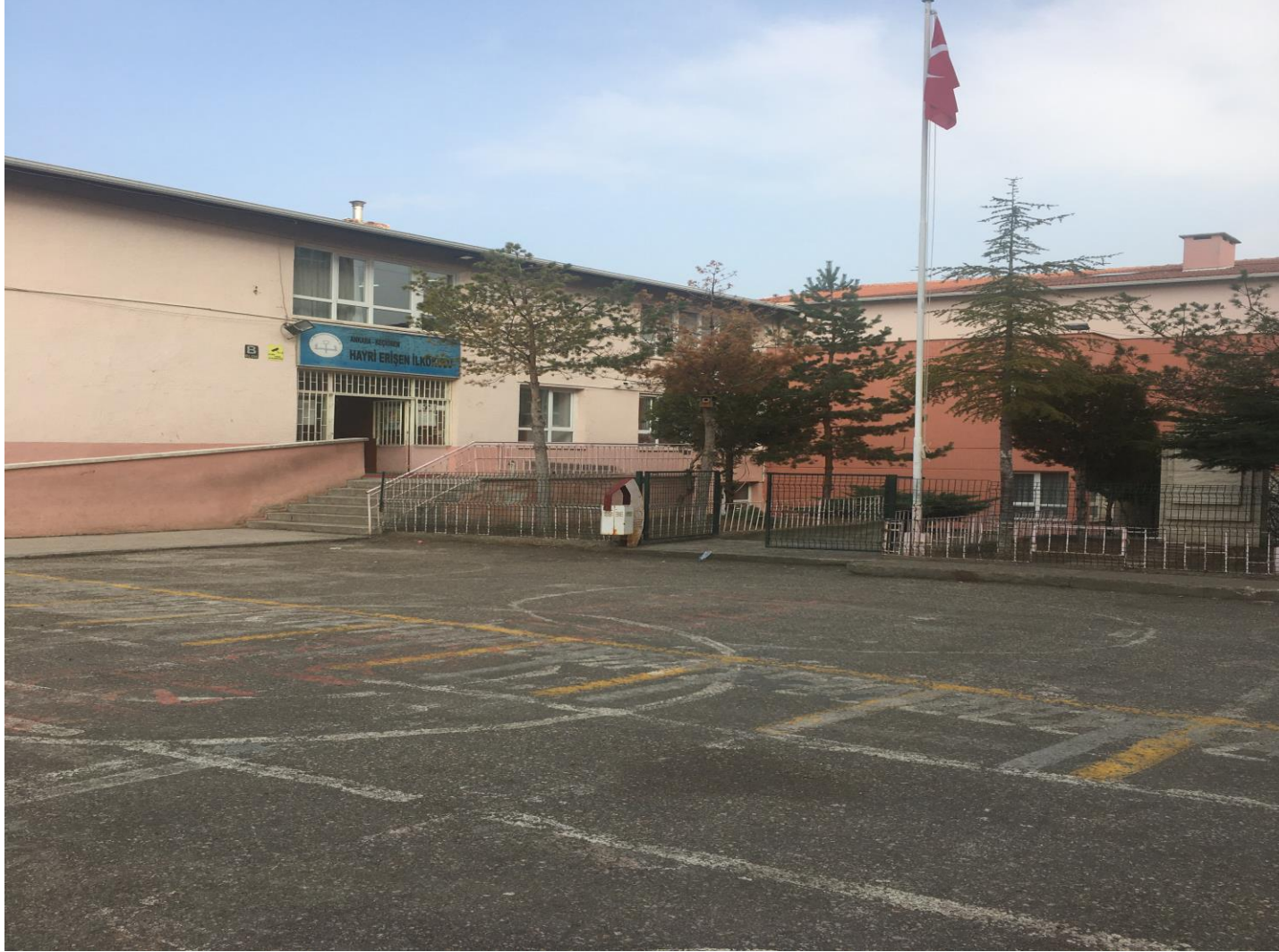
HAYRİ ERİŞEN İLKOKULU